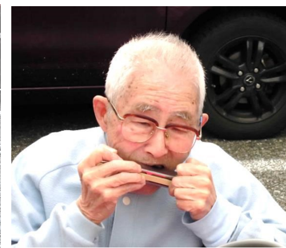
発行 介護老人保健施設 ケアヴィラ伊丹 事務長 宇野 秀幸